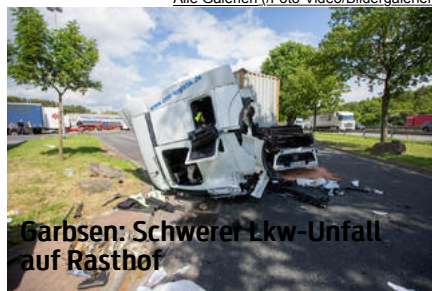
Garbsen: Schwerer Lkw-Unfall auf Rasthof

Alle Galerien (/Foto-Video/Bildergalerien)